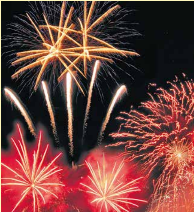
FREITAG 31. MAI 22.30 UHR FEUERWERK vom Brauselayweg