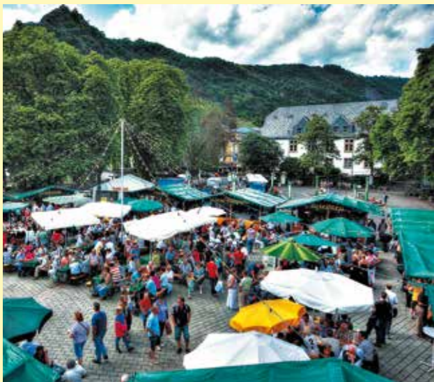
»Weindorf« auf dem Endertplatz